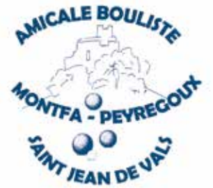
Le boulodrome de Saint-Jean-de-Vals